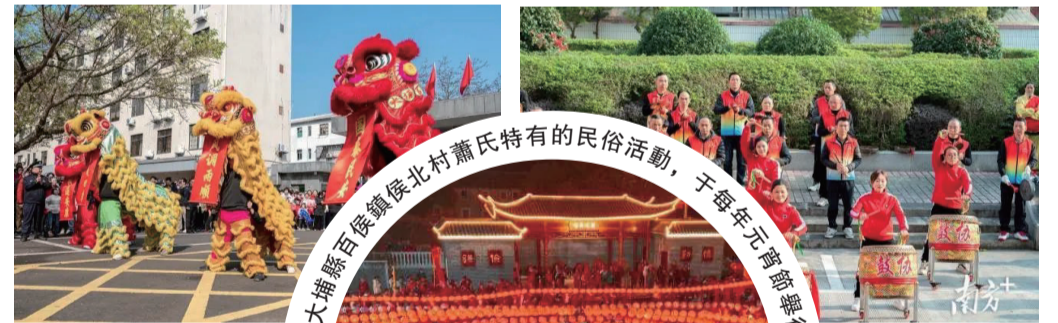
“舞龍舞獅”活動是大埔春節不可或缺的重要環節之一。