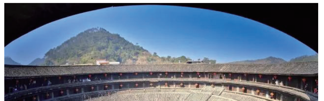
獨特而熱鬧的祭拜儀式與傳奇的土樓相得益彰，是當地特有的春節活動。