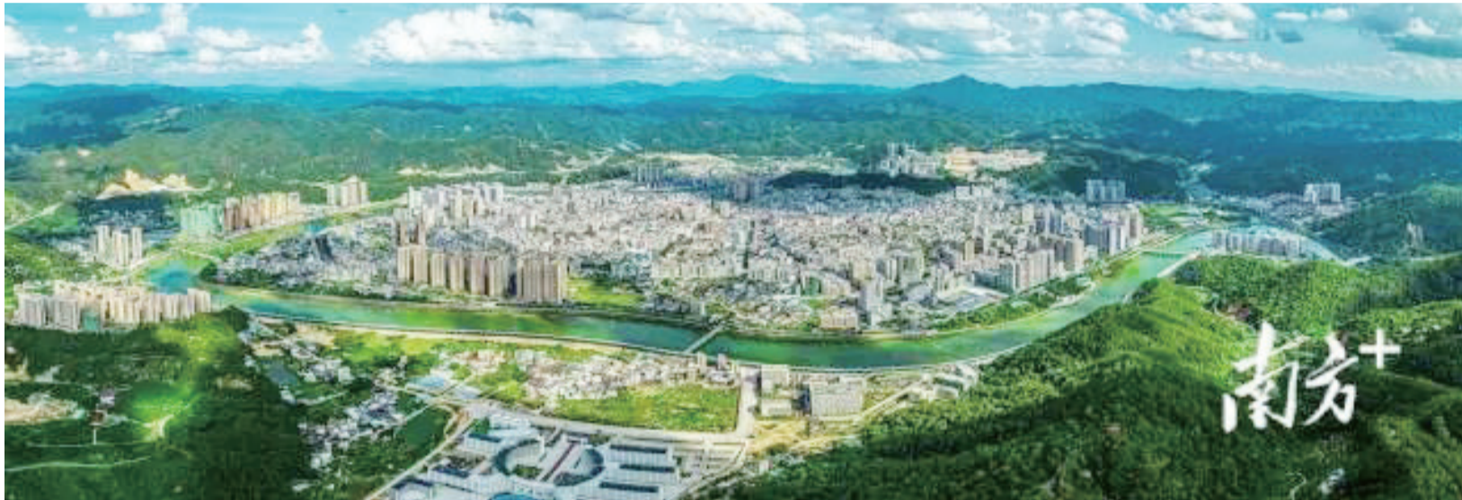
大埔正舉全縣之力推動城鄉區域協調發展，圖為城區航拍。楊開城攝