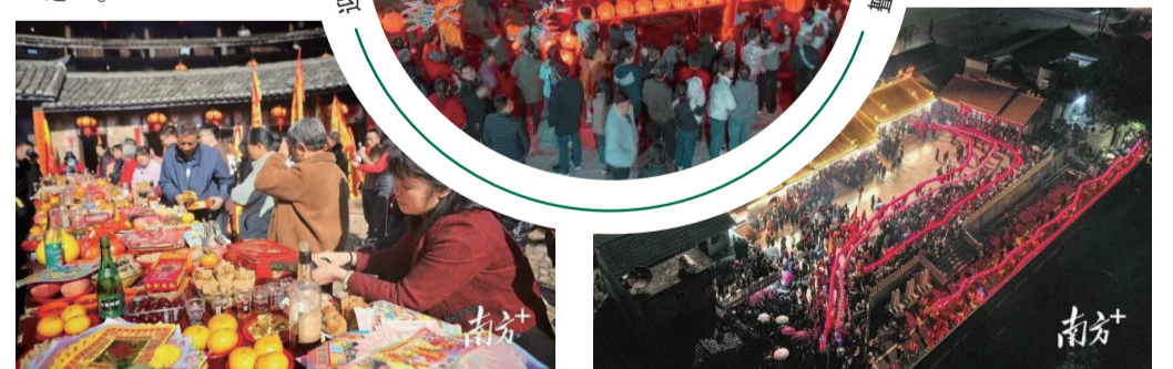
每一條龍珠燈猶如活靈活現的巨龍，在夜色中蜿蜒起伏，流光溢彩。