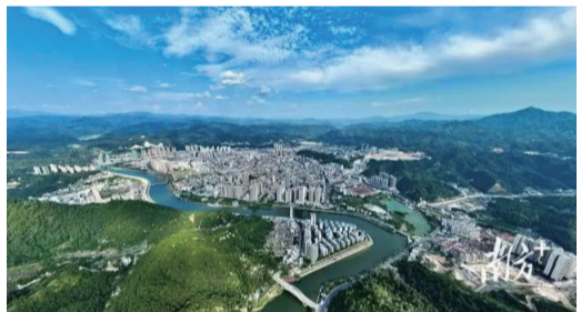
大埔縣高質量發展大會吹響奮進號角，圖為大埔城區航拍。

長期以來，大埔作為廣東的一個小角落，一代代大埔人通過不懈努力、奮勇拼搏始終在追趕時代的發展步伐。然而，不可否認的是，對比粵港澳大灣區、海西區、梅州兄弟縣（區），大埔發展仍然比較落後。這些落後，不僅是區位的落後、資源的落後、政策的落後，本質是大埔生產力的落後，是大埔單位土地面積和單位人口產生經濟效益的落後。